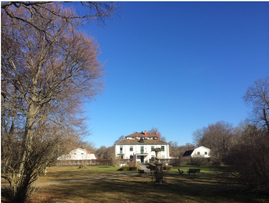
Noors Slott om våren