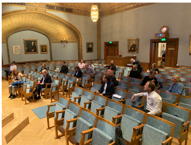
Stora salen på läkaresällskapet gav gott om utrymme för adekvat distansiering

Vi gladdede oss särskilt åt att välkomna nyantagna Fellows. Alla dessa har redan väl utbyggda nationella och internationella nätverk, och vi är mycket glada att kunna knyta dem till Bengt Ihre Fellowship med alla de möjligheter det innebär för vidare nationellt nätverksskapande.